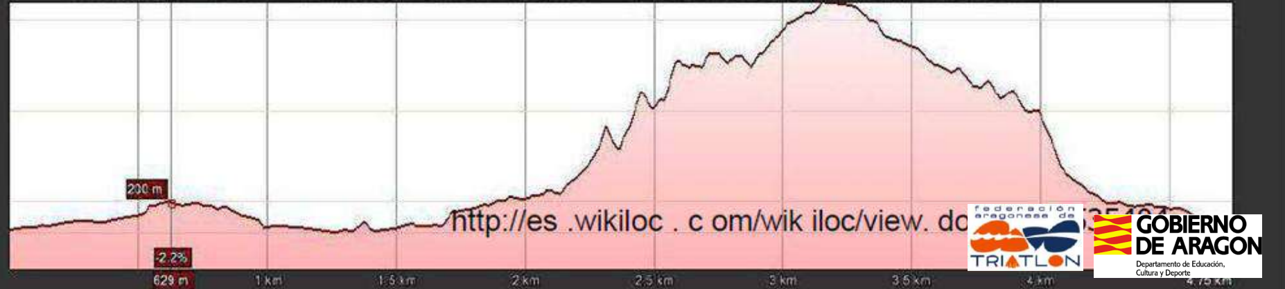
Gráfico: min., media, máx. Elevación: 191, 212, 255 m Total de intervalo: Distancia: 4,75 km Incremento/pérdida de elevación: 107 m, -108 m Pendiente máxima: 24,1%, -21,8% Pendiente media: 4,3%, -4,1%